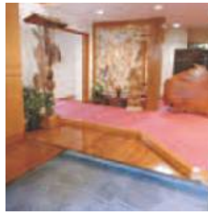
床と柱のけやきの木材が落ち着く 宴会場エントランス

これらの支援も商工会の専門家による複数回シリーズの個別支援を活用させていただきました。