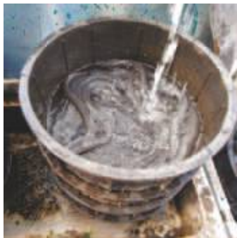
うなぎをきれいな井戸水でさらします

たれは、平成30年7月の150cmを超える床上浸水の時も、大切に保管していたため、無事でした。