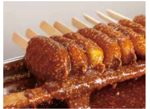
▲受け継がれた秘伝のタレ

きた郷土料理です。例年、恵那市で開催される各種イベントでは、各店舗の味を競うように「五平餅」の店が並び、地元の人には勿論、観光客も列を作るほど好評を得ています。