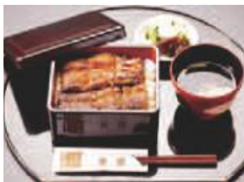
人気のうなぎ料理

そんな中、被災直後から、たくさんのボランティアさんの、泥排出など労務支援と励ましの声があり、再建の意を強くしました。商工会の案内で、関市の災害復旧補助金と国の持続化補助金を活用し、まず厨房と客席店舗を、1次的に開店営業し、2次的に宴会場も、再建して、完全開店することができました。