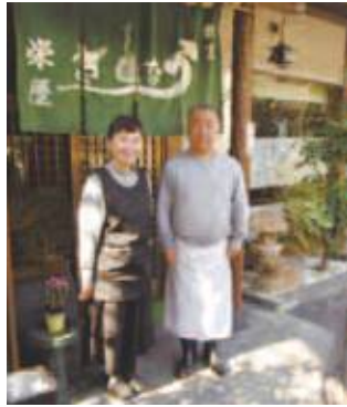
アットホームな雰囲気です

関市上之保地内で創業140年4代続く老舗うなぎ料理・日本料理店です。厳選した、素材・うなぎを、親方の確かな目で仕入れ、おいしい料理を提供しています。うなぎ料理は、仕入れた、うなぎをきれいな井戸水で2～3日さらし、臭みを取り、140年間継ぎ足しの秘伝のたれで、外側の皮等は、香りのいい樹木の皮みたいに、こんがり、かりっと、なかは、ふわっと焼き上げて、口の中で、うなぎと、絶妙なたれの味が楽しめます。当店の一押しです。