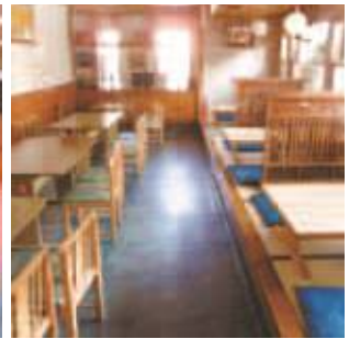
いす席と子供連れ家族も安心 こあがり席

地域の観光資源のかみのほ温泉ほほえみの湯、道の駅平成、かみのほゆずや、椎茸等の特産品、ネイチャーランドかみのほ、八滝ウッディーランドの2つのキャンプ場、高沢観音、地区外の下呂温泉、郡上市、高山市方面の観光地への、中継昼食場所として、案内連携を保って、より一層多くの方に、当店のおいしいうなぎを食べてほしいと考えてます。近年、後継者として長男が従事、修行を積んでおり、新しいお店づくりにも挑戦していきます。