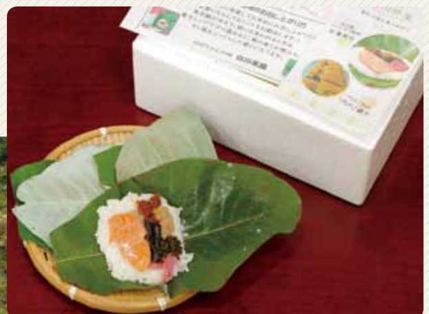
▲ お中元の定番 朴葉寿司セット