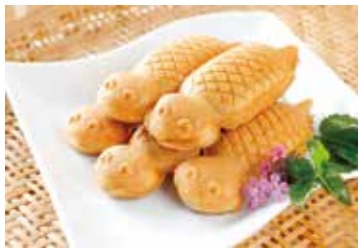
▲SNS映えて人気 つちのこ焼き

上は80代から下は30代と幅広い年齢層が集い、和気あいあいと作業する中でお互いのノウハウを共有できるのは楽しみでもあります。意見を出し合いながら新商品開発にも積極的に取り組んでいます。これまでも村のマスケットである「つちのこ」をモチーフにした商品などを開発してきました。特に人形焼の「つちのこ焼き」はTV放映により大ブレイクし、全国からお買い上げいただきました。