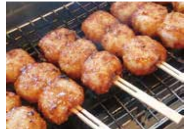
▲地元産米使用 五平餅