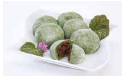
▲あんどから手作り 草大福

Webサイトは、jindoという無料ツールを活用し、県事業(IT経営応援隊岐阜)の支援を受けて構築、その後も自力で管理しています。併せて4種類のSNSを駆使した情報発信で集客効果を高めています。SNSでの情報発信はTV取材につながることも多く、さらなる販路拡大に相乗効果を出しています。コロナ休業中も、タケノコ掘りや朴葉採取など東白川村の里山の風景をSNSで発信し「東白川村のファン作り」