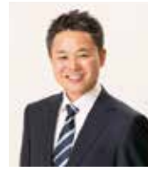
クック ター ネー 学 ブロー カー 業承 ディ コネ 丸 山