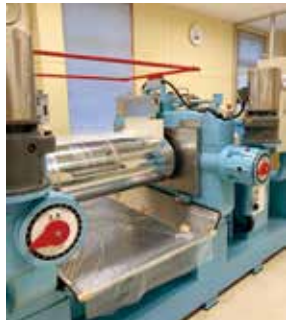
▲ミキシングロール機