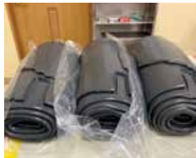
▲ロール状に巻き上げられたシリコーンゴム