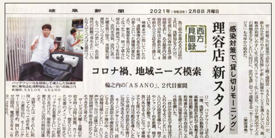
▲新聞に取り上げられた記事

また、昨今のコロナ禍の中で、当店のお客様の消防士や歯科医など感染症に対して特に注意を払っている方々から、人との接触をより少なくしながら散髪をしたいという声を頂いたことをきっかけとして、お客