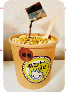
高校生の意見から生まれた新商品(現状)

開発事業がスタートしました。本連携事業では「どんなぼん菓子を開発するか」というアイデア発想から始まり、アイデアの絞り込み、ターゲット顧客の設定と商品コンセプトの具体化を高校生と一緒に行いました。