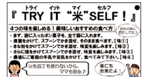
コンセプトと食べ方を紹介するラベル

その後も販売開始に向けて商品化や販路開拓支援を行い、いくつかの小売店で取り扱われるまでになりました。また、「TRY IT “米” SELF! (トライイットマイセルフ)」というキャッチコピーや商品名、売場用POP等も事業者と共に作り上げました。