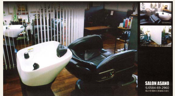
▲補助金を活用して整備した店舗内観

後継者が老人福祉施設へ出張理容サービスに伺った際に、施設の利用者である高齢者の方々から、施設内での散髪だけではなく、本当はお店に行つてゆっくりと会話をしたり、