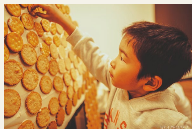
▲お菓子作り体験イベントの様子

これからも子供たちのしあわせな未来に繋がるように、そして「体験×子供服」をより多くの方に届けられるよう、オリジナル子供服の開発や新規事業の立ち上げなど商工会とともに新たなチャレンジにまい進していきます。(所属 養老町商工会)