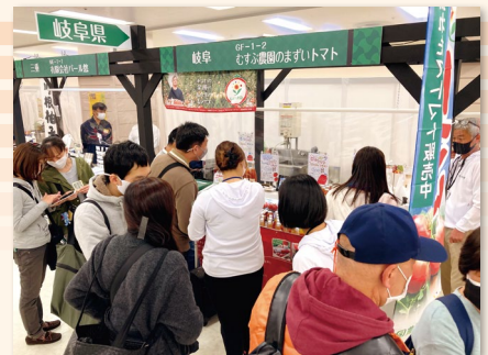
▲昨年の県ブースの様子

全国商工会連合会主催の「ニッポン全国物産展2021」が11月19日（金）～21日（日）の3日間、東京・池袋サンシャインシティで開催されます。本事業は全国商工会連合会「地域力活用新事業創出支援事業」となっております。