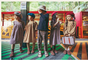
▲体験を彩る服を着た子供たち！

合った可愛い衣装をいつも着せてくれて、嬉しい・楽しいといった感情が動く体験をたくさんさせてくれました。そしてそのようなキラキラ輝いたくさんの記憶から母親の愛情を深く実感し、自分が大人になったときの苦しい時期にはそれが自分の大きな力になりました。このような経験から、短い子育て時期という子供との貴重な時間の中で、多くの子供たちにそのような記憶に残る体験を彩ってもらいたい、そしてその体験を彩る衣装を当店でご提供することで、よりしあわせな体験をしていただき、その体験が子供たちの未来を創ることに繋がればと、このような想いで事業を行っています。