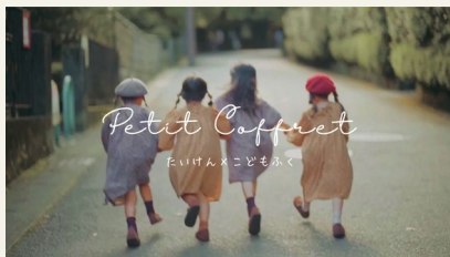
▲当店のコンセプトイメージ

当店は、令和2年7月に創業し、PETIT-COFFRETというショップ名で、ECサイトを通じたネット販売を中心に子供服の販売を行っています。さらに、子供服の販売に合わせて、クリスマスなど季節のクッキングイベントやヨガイベントなど、子供たちが素敵な体験を得られるイベントを自主開催しており、子供服と体験を掛け合わせて提供する「体験×子供服」をコンセプトに事業を行っています。