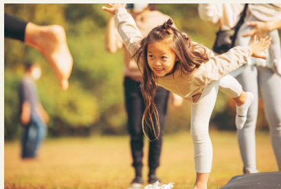
▲ヨガ体験イベントの様子