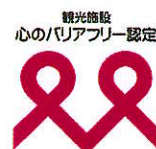
【様式2】印刷物、電子媒体に掲載