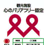
【様式1】施設内や入口に掲示

※ https://www.mlit.go.jp/kankocho/shisaku/sangyou/innovation_00001.html