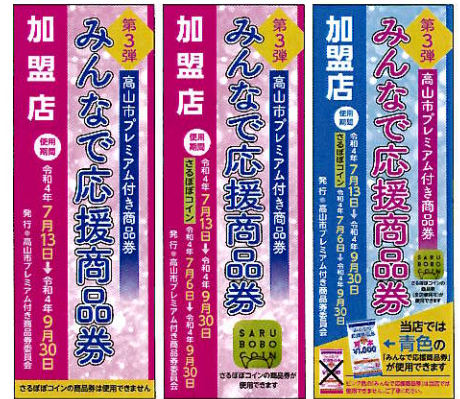
取扱い加盟店表示ポスター