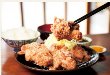
▲究極を追求した「からあげ」

からあげはアレルギーがあっても食べられるように、小麦粉と卵は不使用。片栗粉を使つた昔ながらの「竜田揚げ」を基本にしつつ、衣は硬くなくすぎないように工夫を凝らし、揚げ方も試行錯誤を繰り返して絶妙な食感を実現した。鶏肉は注文を受けてから揚げる。一口噛むと、音がするほどさくつとした食感の衣と、柔らかい肉から旨味が溢れ出す。