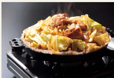
▲秘伝のタレで仕上げた「鶏ちゃん」