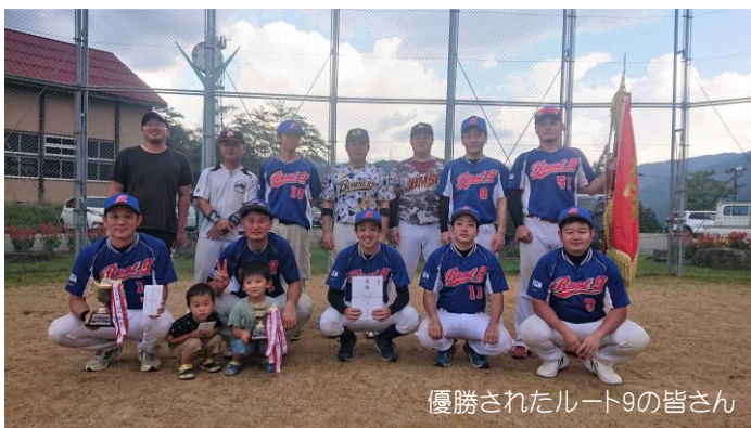
優勝されたルート9の皆さん