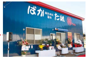
2022年12月にオープンした新工場