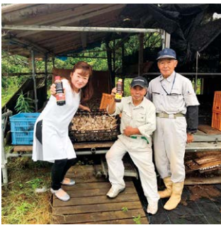
厳選した食材は、自ら現地で調達

しかし販売は当初から順風満帆だったわけではありませんでした。販売店へ営業を重ねるも、一向に売れず、心が折れそうになったことも。転機は、地元食材