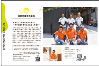
「紙の上の展示会」掲載事例