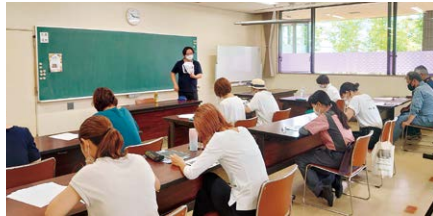
写真撮影講習会の様子

また自社の商品・サービスを実際に冊子として成果物にしたことで、魅力などをどのように伝えたらよいか?など、実践的に営業力向上を図ることができました。