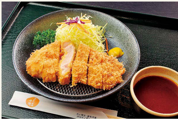
▲当店こだわりのとんかつと特製ドビソース

コロナ以前より来客が減少し始めたことをきっかけにお客様にどうしたら来店していただけるか、当店を知ってもらえるかを考え、やはり当店とはとんかつに力を入れているお店であると思ひ、「とんかつ自慢小池」として取り組んで行くことにしました。それからは、メニュー表の変更や店舗