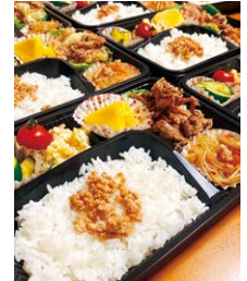
大人気!ばかたれを使ったお弁当

そこで、本格的な製造拠点として、山口市大桑地区に今冬自社工場をオープン。絶品の「ばかたれ」はもちろん、自社のタレを使ったお惣菜の販売コーナーも併設しました。広大な自然と青空の下、一層かがやく新工場で、今日もおいしいタレやお惣菜を販売しています!