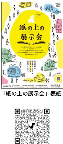
「紙の上の展示会」表紙

商品・サービスをより良く魅せるために写真講習会と個別指導を実施。写真撮影方法の基本的知識とどのような撮影方法があるかを学んで頂きました。その後、専門家に店舗まで出向い