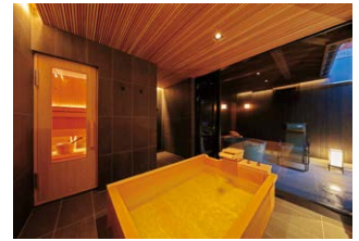
こだわった浴室&サウナ

宿に集中して取り組む時間と空間を提供するサービスです。飛騨古川の「瀬戸川と白壁土蔵街」は、瀬戸川の心地よいゆらぎと白壁土蔵街の静かで落ち着いた雰囲気があり、会議環境や個人が集中するためのスペースを整備することで、より集中できる環境を構築することができました。渡航制限が解除された今、飛騨地方に興味を持っている欧米や東アジアなどにある企業の事業開発合宿などを誘致したいと考えています。