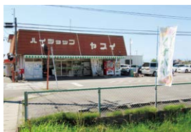
ハイショップヤスイ店舗

同店は安八町にて「安心・安全」かつ「健康」をテーマにこだわり商品力を強めて独自ポジションを築いている小売店です。