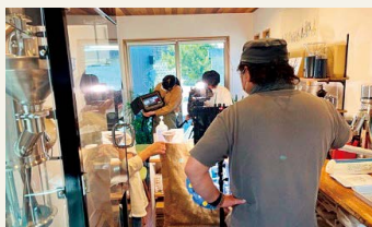
▲東海テレビ取材の様子

◆ 焙煎 幸房 ッそら ◆ ▲ 大垣市墨俣町二ツ木80-1 ☎ 070-2618-5192 🌐 https://coffee-sora.com/