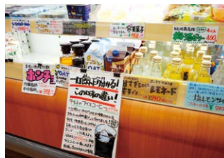
手書きPOPによる商品紹介

店長のこだわりで仕入れた商品の美味しさ等を店長コラムとして折込広告、SNSで発信しファンづくりをさ