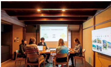
ミーティング風景

しかし、順調だった事業環境はコロナ禍で一変しました。外国人観光客が前年対比で99%減少するという危機的状況のなか、宿泊業だけでは急激な環境の変化に対応できないと、新たに地元のフリーランスや起業家、テレワークなどの新しい働き方に積極的な企業に向けた「コワーキングサテライトオフィス」を開業。また、商工会が申請支援した事業再構築補助金で「コンセントレーション・プロジェクト型ニーズ向け空間提供サービス」に取り組んでいます。コンセントレーションとは、「集中すること」「専念すること」を意味し、コンセントレーション・プロジェクト型ニーズ向け空間提供サービスは、ビジネスプランやクリエイティブなアウトプット、経営会議、事業開発合