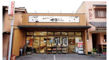
フードショップヤマニシ店舗