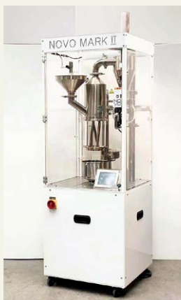
▲焙煎機:NOVO MARK II

改善のために、焙煎工程の効率を上げて販路を開拓したいと商工会に相談したところ、『岐阜県のアフターコロナ・チャレンジ事業者応援補助金』があることを教えて頂き、焙煎機を導入して新たな販路を獲得するための計画作りを行いました。また、『大垣市の経営基盤強化支援事業補助金』も教えて頂き、webサイト改修を行うことでお客様の利便性向上を促せました。今回、商工会と申請書を何度もやり取りする中で、事業計画と経営戦略の重要性に気付くことができました。