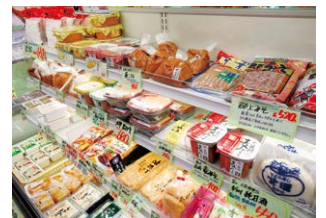
手書きPOPによる商品紹介

地域のマルシェで人気のあるハーブティー・薬草珈琲・ジャガイモドーナツ・わらび餅・ピーガンスイーツ等の事業者、同店の店先等に出品の機会を作られています。