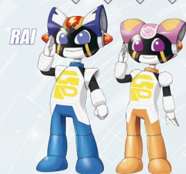
岐阜県警察マスコット