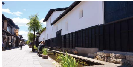
瀬戸川と白壁土蔵街