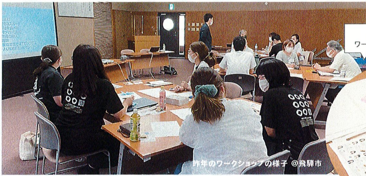
座学を中心に、簡単なワークショップを予定しています。