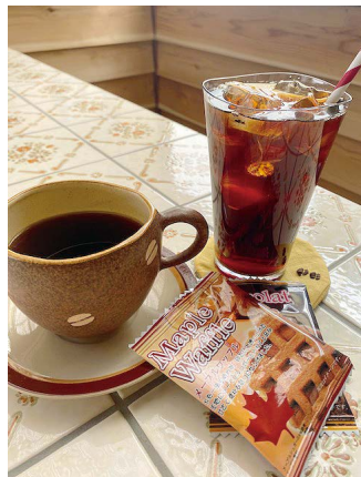
コーヒースタンドの商品

珈琲こよみのこだわりは、なんと言っても品質の高い珈琲豆です。フェアトレードで仕入れたオーガニックコーヒーや高品質スペシャルティコーヒーの提供をしています。自家焙煎をすることで、焼きたてで新鮮な風味豊かなコーヒーを味わえます。