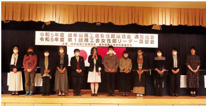
▲新役員のみなさん

なお、総会に先立ち、「女性部功労者」の表彰並びに感謝状等の贈呈が行われました。（被表彰者は左記表2のとおり）