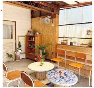
レトロで可愛い店内