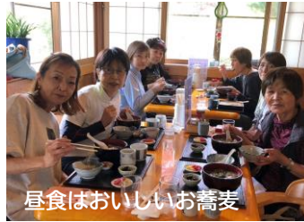
昼食はおいしいお蕎麦

地域の環境整備に協力して、梅雨の晴れ間の6月13日(火)に高根町地内の国道361号線沿いの花壇でマリーゴールドをはじめ5種類300本の苗の植栽に汗を流しました。