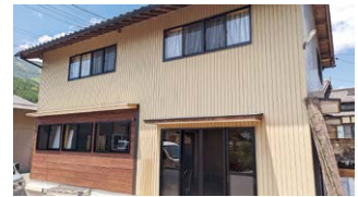
車庫を改修して完成した新工場

令和4年に具体的な計画が完成。現在までにか「円滑な事業承継の実行」、「菓子製造における生産性向上に向けた機械設備導入」「老朽化した工場の移転」など、各種施策を活用しながら実行しています。8月から新工場の稼働がスタートしました。