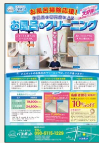
▲こだわりのチラシ