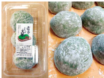
看板商品のよもぎ大福 1個120円(税込)

「平野屋のよもぎ大福」は地元素材の味、風味を生かした商品づくりに定評があり、地域の住民の方にとっても家庭消費や贈答品利用も大変多くご利用をいただいております。また、下呂や高山に観光にお越しになる県外の観光客の方々にも広く認知をいただいております。いつも販売所の商品は夕方ごろには完売となっています。