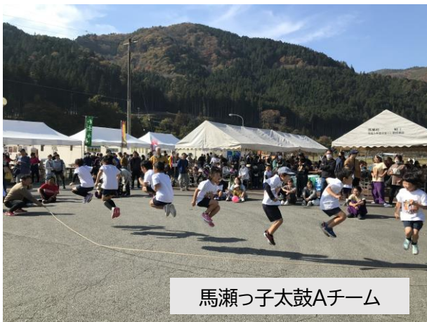
馬瀬っ子太鼓Aチーム

飛ぶ人も、そうでない人も笑顔あふれる時間になったと思います。一位は「堀之内チーム」、アイデア賞「馬瀬っ子