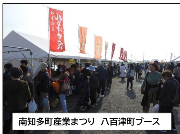
南知多町産業まつり 八百津町ブース