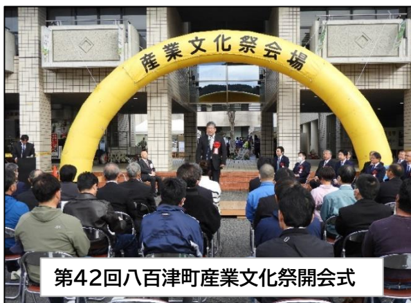
第42回八百津町産業文化祭開会式

また、11月5日(日)友好交流の町である南知多町の産業まつりに特産品交流事業として八百津町内地域産品取扱い事業者の方々が参加しました。