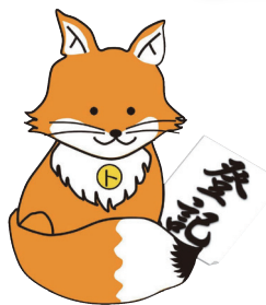
不動産登記推進 イメージキャラクター 「トウキツネ」