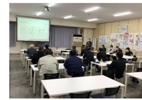
四町工業部会視察研修 (11月)