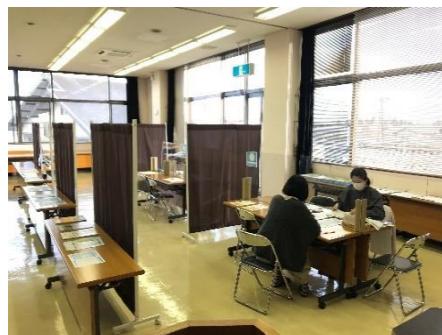
年末調整・確定申告指導 (1月～3月)