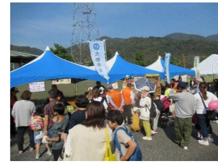
おおのフェスタ&木育フェア (11月)