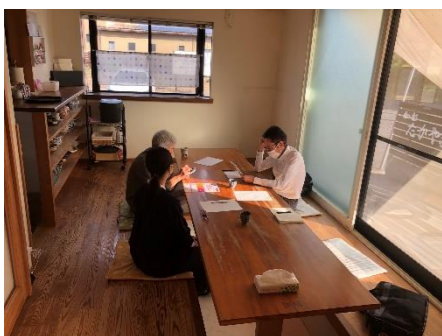
IT個別相談会 (8月～12月10日間)