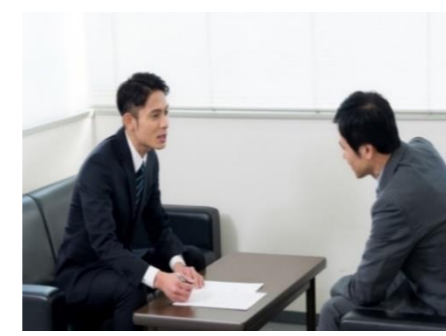
弁護士個別相談会 (随時)