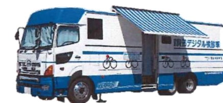
従業員等定期健康診断 (8月)