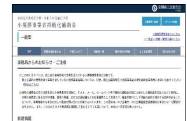
小規模事業者持続化補助金 (一般型)