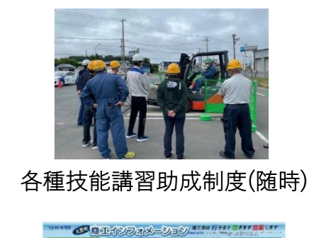
各種技能講習助成制度(随時)