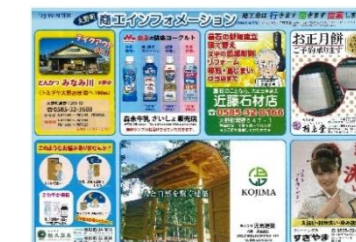
共同広告チラシ(年3回)