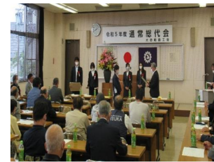
総代会・従業員永年勤続表彰 (5月)