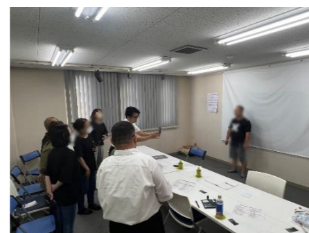
写真個別相談会(9月)