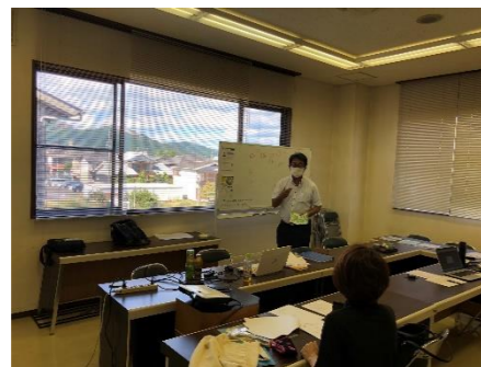
経営計画作成個別相談会 (8月～12月10日間)