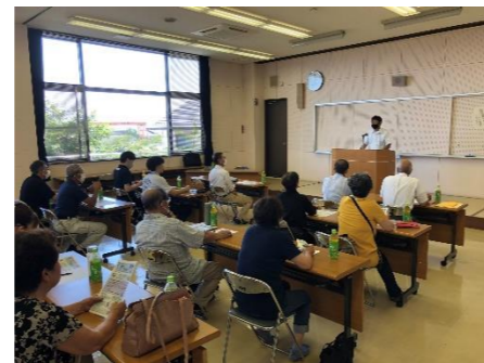
インボイス講習会 (7月)