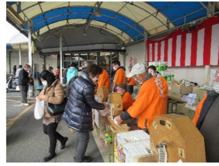
年末年始感謝セール (1月)