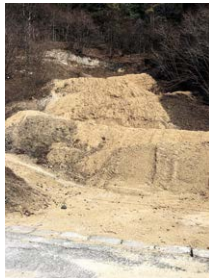
石灰華堆積の様子

高山市奥飛騨温泉郷で、温泉沈殿物の一種である石灰華を主原料とする入浴剤を製造販売している企業です。同社の敷地内にある、高さ・幅が数十メートルある巨大な石灰華堆積物は、学術調査の結果、西暦1100年ごろから数百年かけて堆積されたものであることが分かっています。