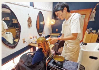
▲草木染の施術風景