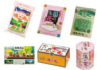
商品ラインナップ

これは既存ユーザーから寄せられる「湯の花を贈って喜ばれた」、「湯の花をもらって嬉しかった」という喜びの声に着想を得たものです。「ある人が、誰かに思いやり(CARE)を伝えることを目的としてギフトを贈るという行動」に「CARE GIFTING」と名付け、これを自社製品の「湯の花」を通じて推進していきます。