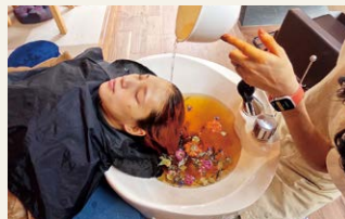
▲自家栽培で育てたハーブで頭浸浴

受け、自然とオーガニックを掛け合わせた自然派ブランディングを考案しました。ストレスが無く、安心して受けられる施術は、多くのお客様に喜ばれています。