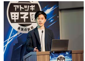
アツギ甲子園登壇の様子

後継者 蛭氏は、第4回アツギ甲子園(主催:中小企業庁)にエントリー、書類審査を見事通過し、去る2月16日に開催された関東・中部ブロック大会に出場しました。出場にあたっては商工会も支援させていただきました。