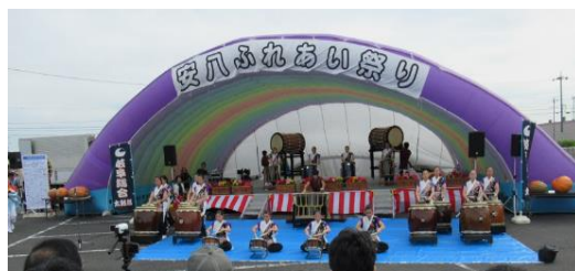
以前の安八ふれあい祭りの様子

「安八ふれあい祭り2024」が11月9日(土)10日(日)に開催されます。今年も多彩な(各種イベント・バザー)を予定していますので、ご家族等お誘い合わせのうえ、多数のご来場お待ちしております！