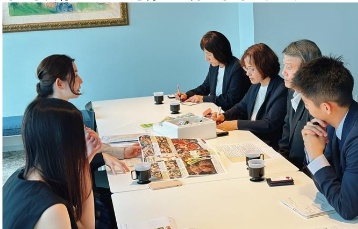
▲バイヤーのオフィスでの商談の様子（2024年度実施風景）

【事業内容】 決定権者のバイヤーとの商談（1件あたり30分～60分の間）を1事業者につき2件以上行います。なお、本事業は選考を経て、最大10事業者限定のサービスとなります（事業全体で20商談を実施）。