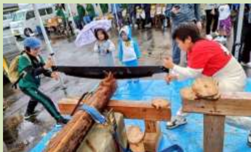
ふたりのこぎり体験