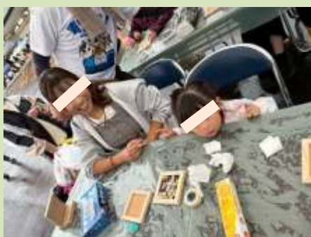
左官 de アート