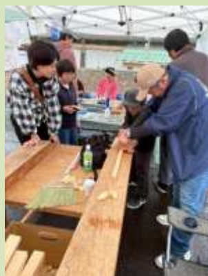
カンナけずり体験