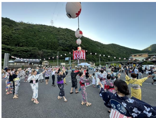
(浴衣姿が素敵な盆踊り)

青年部主催の夏まつりが7月26日(土)、新しい形で開催されました。異常気象が多く発生する時期の開催で天候が心配されましたが、前日の準備から翌日の片付けまで雨に降られることなく終わることができました。当日は、町内外から想像をはるかに超える多くの方々にご来場いただき、盆踊りは小さなお子様からベテランまで汗だくになりながらも楽しく踊っていただきました。町内の小中学校の児童・生徒の皆さんに絵付けをしていただいた提灯も、夜空をきれいに照らしてくれていました。初回ということもあり、飲食物が早々に売り切れてしまいご迷惑をお掛けしましたが、いこ舞経験者もそうでない方も、大いに楽しめたお祭りになりました。