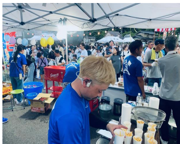
(ブース内は大忙し)

12名の部員のほとんどが祭り運営未経験であり、手探りの準備でしたが、親会、青年部OB、女性部、また役場の方々にお力添えをいただき盛大に開催することができました。これもひとえに皆様方のご支援の賜物と心より感謝申し上げます。