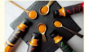
審査員特別賞を受賞した 「チリソース「MY CHILI(マイチリ)」」