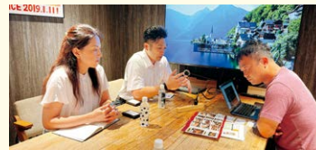
バイヤーオフィスでの 商談風景

株式会社川畔 (郡上市商工会) 有限会社藤乃屋 (八百津町商工会) 有限会社山サ寒天産業 (恵那市恵南商工会) Miya foods (坂祝町商工会) 株式会社おくみの園グループ (郡上市商工会) 株式会社肉の御嵩屋 (八百津町商工会) 一力屋 (白川町商工会) Soielle (笠松町商工会)