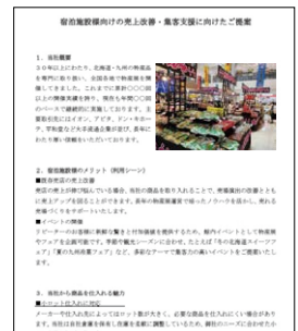
見直し後の営業ツール