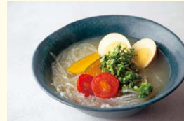
審査員特別賞を受賞した 「細寒天ヌードル」