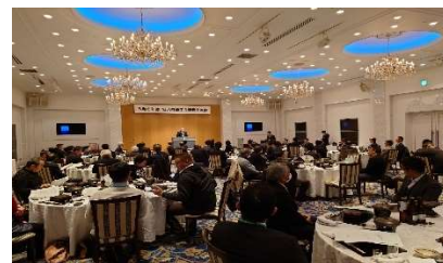
新春交流会の様子