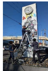
青年部清掃活動の様子

また、女性部は12月17日、地域バックアップ事業の一環として寄せ植え講習会を開催しました。季節感あふれる花材を用い、講師の丁寧な指導のもと、参加者それぞれが個性ある作品を完成させ、会場は終始明るく和やかな雰囲気に包まれました。