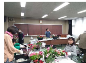
寄せ植え講習会の様子