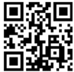
警察庁×トレンドマイクロ