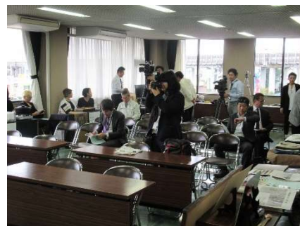
以前のプレスリリースの様子