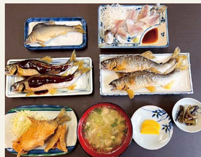
▲「季節の旬 清流の良さ 新鮮さ」が詰まったコース料理

引き継ぎについては、従前から調理場の中心を担っているベテラン料理長の継続雇用を含め、前店主の協力的な配慮があり、「伝統の味」を円滑に受け継ぐことができました。