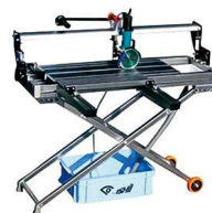
大判タイル切削機