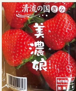
▲ブランド苺「美濃娘」

令和7年に運上館を事業承継する前は、「かとういちご園」と建設業（とび職）の兼業をしていました。現在も栽培している「美濃娘」は、甘味と酸味のバランスが良く、岐阜県を代表するブランド苺です。そうした中で、いちご農園のお客様でもあった、運上館の前店主より「店を引き継ぐことができる人を探している」という相談があったため、建設業に替わる部門として、事業承継により鮎料理店の経営に家族で挑戦するという大きな転換期が到来しました。